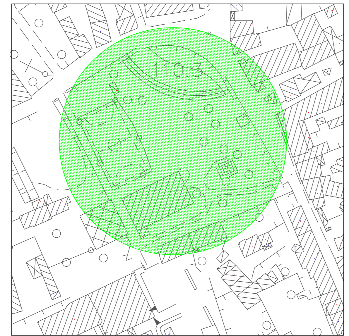
CARTA TECNICA REGIONALE COMUNE DI REMANZACCO Scala 1:1000